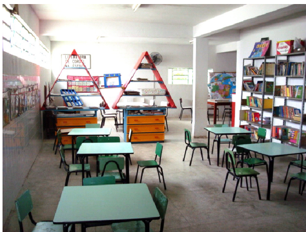
Imagem 06: Biblioteca da escola

O Pró-Jovem, programa do Governo Federal em parceria com o município, usa sala da SAB para as atividades que envolvem jovens do Jardim Borborema e bairros vizinhos. O grupo também tem acesso à biblioteca, mas ainda sente necessidade de um espaço maior para realizar as atividades recreativas, que se realizam uma vez por semana.